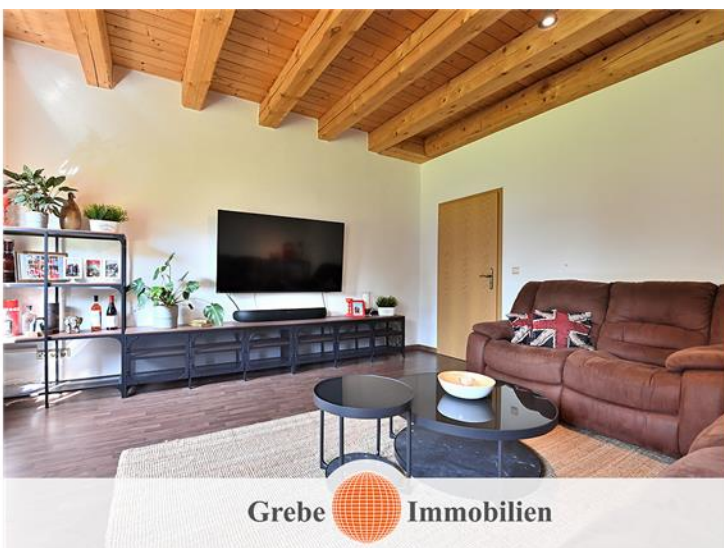
EG rechts Wohnzimmer