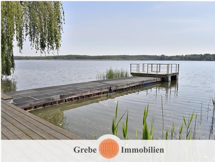
Steganlage am Mellensee