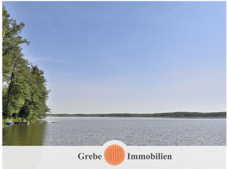
Blick auf den Mellensee