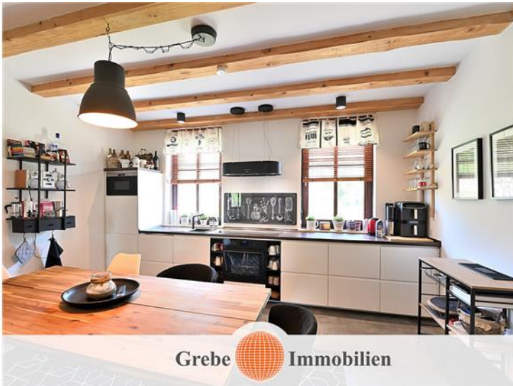
EG rechts, Wohnküche