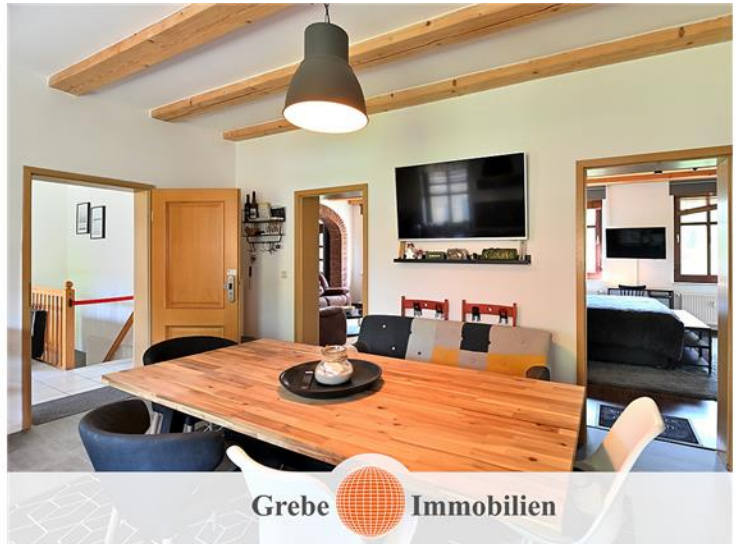
Wohnküche Bild 2